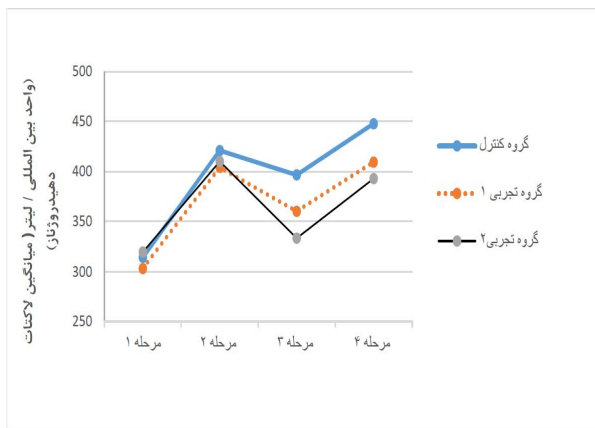
نمودار 1. مقادیر لاکتات دهیدروژناز در مراحل مختلف اندازه‌گیری در سه گروه * نشانه معنی‌داری است.

ویژگی‌های آزمودنی‌ها در جدول 1 و مقایسه میانگین مقدار CK و LDH سرم سه گروه در مراحل مختلف در نمودار 1 و 2، ارائه شده است. مقایسه اثر آغاز در دو گروه تجربی یک و دو با گروه کنترل نیز در جدول 2 نشان داده شده است. نتایج آزمون تحلیل واریانس مکرر نشان داد که فعالیت CK و LDH در مردان کشتی‌گیر بعد از دو هفته مکمل‌یاری آغاز کاهش معنی‌داری در دو گروه تجربی یک و دو نسبت به