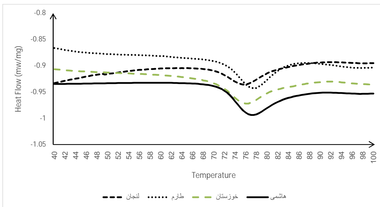
شکل 1. منحنی ژلاتیناسیون نمونه‌های آرد برنج

*حروف متفاوت در هر سطر نشان‌دهنده معنی‌داری اختلاف در سطح 0.05 است