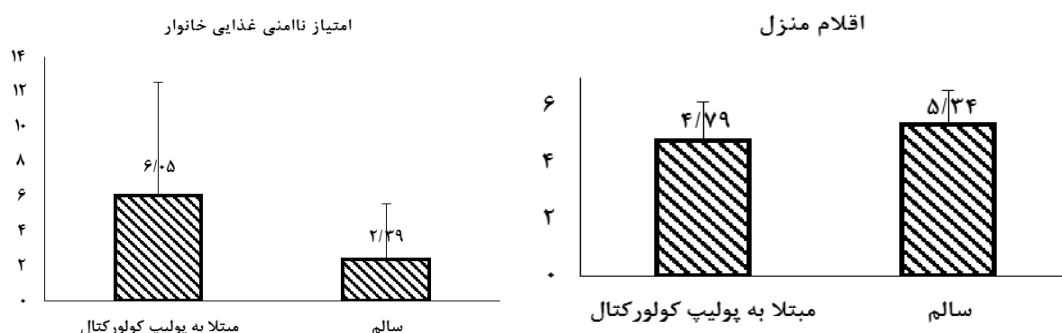
شکل ۱. میانگین و انحراف معیار متغیرهای کمی در گروه مبتلا به پولیپ کولورکتال و سالم، ۱۴۰۰-۱۳۹۹، شهر اصفهان، P آزمون T-test معنی‌دار در سطح > ۰/۰۵

معنی‌دار با بیماری پولیپ کولورکتال داشتند (جدول ۱ و شکل ۱). سایر متغیرها، وضعیت تأهل (P-value=۰/۳۴)، جنس (P-value=۰/۲۸)، وضعیت فعالیت فیزیکی (P-value=۰/۱)،