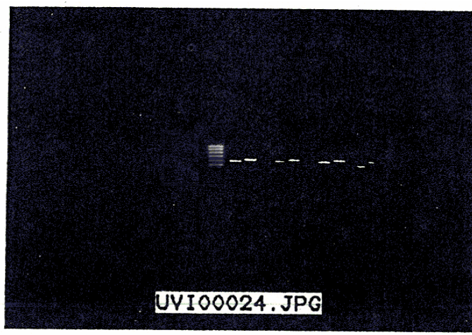
شکل ۲- الگوی الکتروفورز DNA استخراج شده از غلظت‌های متفاوت سالمونلا تیفی‌موریوم در مواد غذایی پس از ۱۲ ساعت غنی‌سازی در محیط BPW روی ژل آگاروز

در شکل به ترتیب، از چپ به راست، باندهای مربوط به جفت پرایمر ST 11 و ST 15 (اندازه قطعه تکثیر شده ۴۲۹bp) و جفت پرایمر T ym , F li (اندازه قطعه تکثیر شده ۵۵۹bp) در نواحی ۵ و ۶ مربوط به غلظت ۱۰ -۲ ، در نواحی ۷ و ۸ مربوط به غلظت ۱۰ -۳ ، در نواحی ۹ و ۱۰ مربوط به غلظت ۱۰ -۱ ، در نواحی ۱۱ و ۱۲ مربوط به غلظت ۵ و سایز مارکر بین نواحی ۴ و ۵ مشاهده می‌شود. در نواحی ۱ و ۲ مربوط به نمونه شیر پاستوریزه تهیه شده از بازار مصرف و در نواحی ۳ و ۴ مربوط به نمونه BPW (کنترل منفی) و همچنین نواحی ۱۵ و ۱۶ مربوط به غلظت ۱۰ -۱ که هیچ باندهای مربوط به جفت پرایمر فوق مشاهده نمی‌شود.