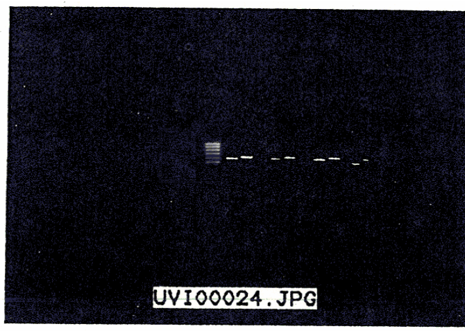
شکل ۲- الگوی الکتروفورز DNA استخراج شده از غلظت‌های متفاوت سالمونلا تیفی موریوم در مواد غذایی پس از ۱۲ ساعت غنی‌سازی در محیط BPW روی ژل آگاروز

در شکل به ترتیب، از چپ به راست، باندهای مربوط به جفت پرایمر ST 11 و ST 15 (اندازه قطعه تکثیر شده ۴۲۹bp) و جفت پرایمر T ym , F li (اندازه قطعه تکثیر شده ۵۵۹bp) در نواحی ۵ و ۶ مربوط به غلظت ۱۰ -۲ ، در نواحی ۷ و ۸ مربوط به غلظت ۱۰ -۱ ، در نواحی ۹ و ۱۰ مربوط به غلظت ۱۰ -۱ ، در نواحی ۱۱ و ۱۲ مربوط به غلظت ۵ و ۴ و ۳ و ۲ و ۱ مربوط به نمونه شیر پاستوریزه تهیه شده از بازار مصرف و در نواحی ۳ و ۴ مربوط به نمونه BPW (کنترل منفی) و همچنین نواحی ۱۵ و ۱۶ مربوط به غلظت ۱۰ -۱ که هیچ باندهای مربوط به جفت پرایمر فوق مشاهده نمی‌شود.