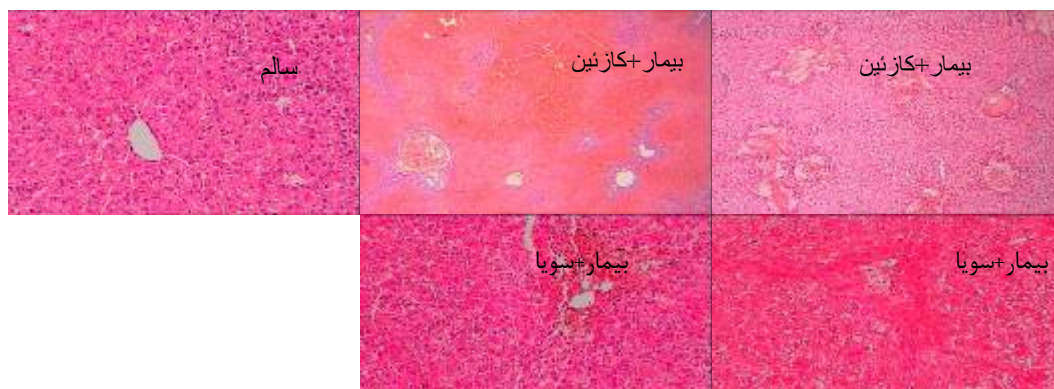
شکل ۲- یافته‌های هیستوپاتولوژیکی بافت کبد

§ در هر ردیف، حروف متفاوت، نشان‌دهنده تفاوت معنی‌دار در سطح P < 0.05 است. برای مقایسه گروه‌ها از آزمون ANOVA یک طرفه استفاده شد. #AST= اسپارات آمینوترانسفراز، ALT= آلانین آمینو ترانسفراز