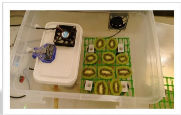
شکل ۱. چینش کیوی‌های برش داده شده در دستگاه مه‌پاش ساخته شده